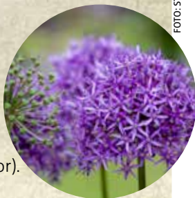
Flor de cebola