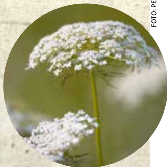
Flor da cenoura